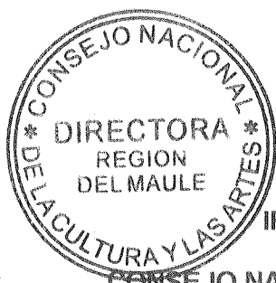
IRENE ALBORNOZ SATELER DIRECTORA REGIONAL CONSEJO NACIONAL DE LA CULTURA Y LAS ARTES REGION DEL MAULE