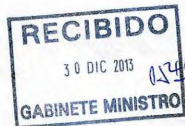
RICARDO PROVOSTE ACEVEDO Contralor Regional Valparaíso CONTRALORÍA GENERAL DE LA REPÚBLICA