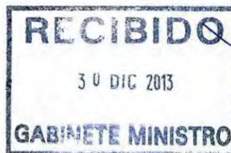
RICARDO PROVOSTE ACEVEDO Contralor Regional Valparaíso CONTRALORÍA GENERAL DE LA REPÚBLICA