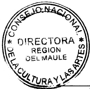
IRENE ALBORNOZ SATELER DIRECTORA REGIONAL CONSEJO NACIONAL DE LA CULTURA Y LAS ARTES REGIÓN DE DEL MAULE