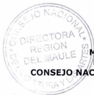
MARIANA DEISLER COLL DIRECTORA REGIONAL CONSEJO NACIONAL DE LA CULTURA Y LAS ARTES REGIÓN DEL MAULE