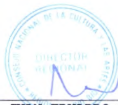
JUAN EDUARDO KING CALDICHOURY DIRECTOR REGIONAL CONSEJO NACIONAL DE LA CULTURA Y LAS ARTES REGIÓN DE DEL BIOBÍO