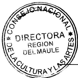
IRENE ALBORNOZ SATELER DIRECTORA REGIONAL CONSEJO NACIONAL DE LA CULTURA Y LAS ARTES REGIÓN DE DEL MAULE