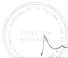
JUAN EDUARDO KING CALDICHOURY DIRECTOR REGIONAL CONSEJO REGIONAL DE LA CULTURA Y LAS ARTES REGIÓN DEL BÍO BÍO