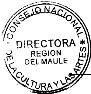
IRENE ALBORNOZ SATELER DIRECTORA REGIONAL CONSEJO NACIONAL DE LA CULTURA Y LAS ARTES REGIÓN DEL MAULE