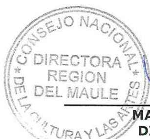
MARIANA DEISLER COLL DIRECTORA REGIONAL CONSEJO NACIONAL DE LA CULTURA Y LAS ARTES REGIÓN DEL MAULE