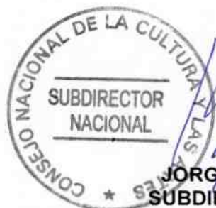
JORGE ROJAS GOLDSACK SUBDIRECTOR NACIONAL (S) CONSEJO NACIONAL DE LA CULTURA Y LAS ARTES