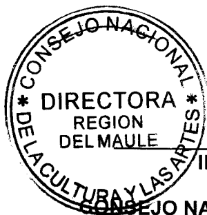
IRENE ALBORNOZ SATELER DIRECTORA REGIONAL CONSEJO NACIONAL DE LA CULTURA Y LAS ARTES REGIÓN DEL MAULE