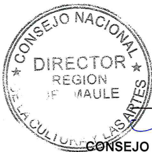
EDGARDO CÁCERES MUÑOZ DIRECTOR REGIONAL CONSEJO NACIONAL DE LA CULTURA Y LAS ARTES REGIÓN DEL MAULE