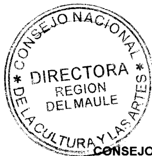
IRENE ALBORNOZ SATELER DIRECTORA REGIONAL CONSEJO NACIONAL DE LA CULTURA Y LAS ARTES REGIÓN DEL MAULE