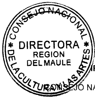
IRENE ALBORNOZ SATELER DIRECTORA REGIONAL CONSEJO NACIONAL DE LA CULTURA Y LAS ARTES REGIÓN DEL MAULE