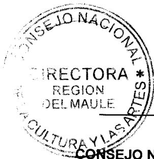
IRENE ALBORNOZ SATELER DIRECTORA REGIONAL CONSEJO NACIONAL DE LA CULTURA Y LAS ARTES REGIÓN DEL MAULE