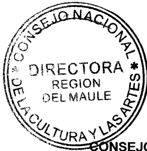
IRENE ALBORNOZ SATELER DIRECTORA REGIONAL CONSEJO NACIONAL DE LA CULTURA Y LAS ARTES REGIÓN DEL MAULE