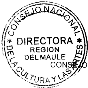
IRENE ALBORNOZ SATELER DIRECTORA REGIONAL CONSEJO NACIONAL DE LA CULTURA Y LAS ARTES REGIÓN DEL MAULE