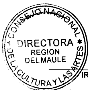
IRENE ALBORNOZ SATELER DIRECTORA REGIONAL CONSEJO NACIONAL DE LA CULTURA Y LAS ARTES REGIÓN DEL MAULE