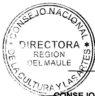
IRENE ALBORNOZ SATELER DIRECTORA REGIONAL CONSEJO NACIONAL DE LA CULTURA Y LAS ARTES REGIÓN DEL MAULE