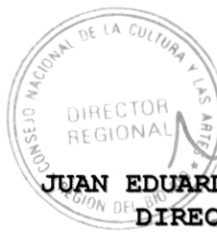
JUAN EDUARDO KING CALDICHOURY DIRECTOR REGIONAL CONSEJO NACIONAL DE LA CULTURA Y LAS ARTES REGIÓN DE BIOBIO