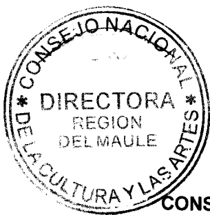
IRENE ALBORNOZ SATELER DIRECTORA REGIONAL CONSEJO NACIONAL DE LA CULTURA Y LAS ARTES REGIÓN DEL MAULE