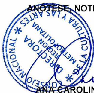
ANA CAROLINA ARRIAGADA URZUA DIRECTORA CONSEJO NACIONAL DE LA CULTURA Y LAS ARTES REGIÓN METROPOLITANA