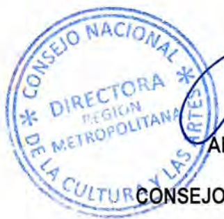
ANA CAROLINA ARRIAGADA URZÚA DIRECTORA CONSEJO NACIONAL DE LA CULTURA Y LAS ARTES REGIÓN METROPOLITANA