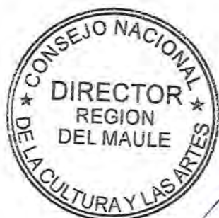
EDGARDO CÁCERES MUÑOZ DIRECTOR REGIONAL CONSEJO NACIONAL DE LA CULTURA Y LAS ARTES REGIÓN DEL MAULE