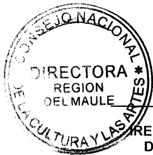
IRENE ALBORNOZ SATELER DIRECTORA REGIONAL CONSEJO NACIONAL DE LA CULTURA Y LAS ARTES REGIÓN DEL MAULE