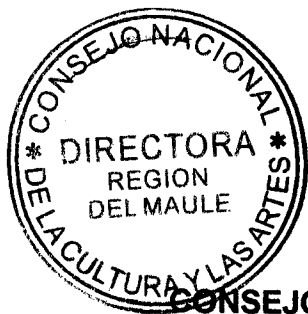
IRENE ALBORNOZ SATELER DIRECTORA CONSEJO NACIONAL DE LA CULTURA Y LAS ARTES REGION DEL MAULE