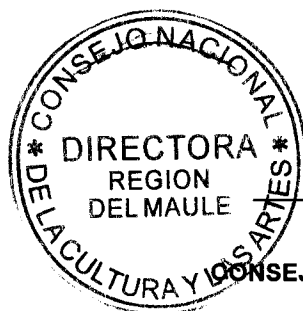
IRENE ALBORNOZ SATELER DIRECTORA REGIONAL CONSEJO NACIONAL DE LA CULTURA Y LAS ARTES REGIÓN DEL MAULE