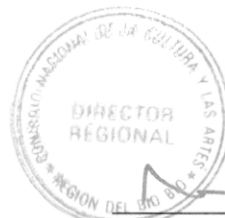
JUAN EDUARDO KING CALDICHOURY DIRECTOR REGIONAL CONSEJO NACIONAL DE LA CULTURA Y LAS ARTES REGIÓN DE BIOBIO