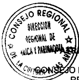
SUSANA AREVALO FERNANDEZ DIRECTORA REGIONAL CONSEJO NACIONAL DE LA CULTURA Y LAS ARTES REGIÓN DE ARICA Y PARINACOTA