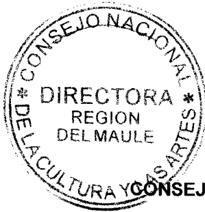
IRENE ALBORNOZ SATELER DIRECTORA REGIONAL DEL MAULE CONSEJO NACIONAL DE LA CULTURA Y LAS ARTES