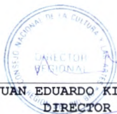
JUAN EDUARDO KING CALDICHOURY DIRECTOR REGIONAL CONSEJO NACIONAL DE LA CULTURA Y LAS ARTES REGIÓN DEL BIOBÍO