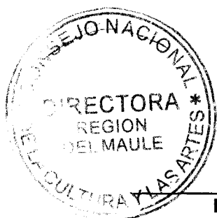
IRENE ALBORNOZ SATELER DIRECTORA REGIONAL CONSEJO NACIONAL DE LA CULTURA Y LAS ARTES REGIÓN DEL MAULE