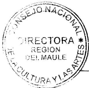
IRENE ALBORNOZ SATELER DIRECTORA REGIONAL CONSEJO NACIONAL DE LA CULTURA Y LAS ARTES REGIÓN DEL MAULE