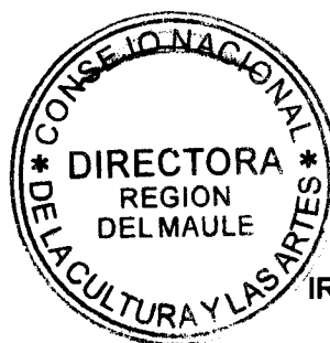
IRENE ALBORNOZ SATELER DIRECTORA REGIONAL CONSEJO NACIONAL DE LA CULTURA Y LAS ARTES REGIÓN DEL MAULE