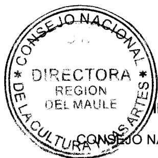
IRENE ALBORNOZ SATELER DIRECTORA REGIONAL CONSEJO NACIONAL DE LA CULTURA Y LAS ARTES REGIÓN DEL MAULE