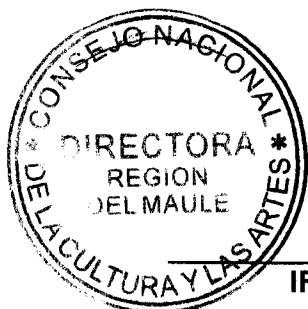
IRENE ALBORNOZ SATELER DIRECTORA REGIONAL CONSEJO NACIONAL DE LA CULTURA Y LAS ARTES REGIÓN DEL MAULE