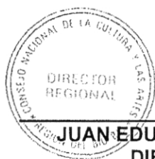
JUAN EDUARDO KING CALDICHOURY DIRECTOR REGIONAL CONSEJO NACIONAL DE LA CULTURA Y LAS ARTES REGIÓN DEL BIO BIO