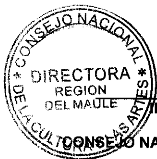
IRENE ALBORNOZ SATELER DIRECTORA REGIONAL CONSEJO NACIONAL DE LA CULTURA Y LAS ARTES REGIÓN DEL MAULE