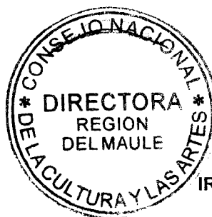
IRENE ALBORNOZ SATELER DIRECTORA REGIONAL CONSEJO NACIONAL DE LA CULTURA Y LAS ARTES REGIÓN DEL MAULE