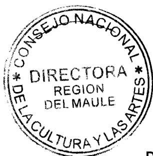
IRENE ALBORNOZ SATELER DIRECTORA REGIONAL DEL MAULE CONSEJO NACIONAL DE LA CULTURA Y LAS ARTES