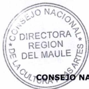
MARIANA DEISLER COLL DIRECTORA REGIONAL CONSEJO NACIONAL DE LA CULTURA Y LAS ARTES REGIÓN DEL MAULE