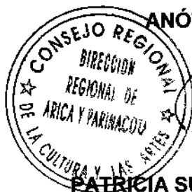
PATRICIA SUSANA AREVALO FERNANDEZ DIRECTORA REGIONAL CONSEJO NACIONAL DE LA CULTURA Y LAS ARTES REGIÓN DE ARICA Y PARINACOTA