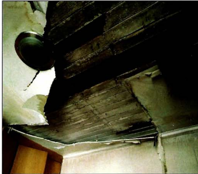
Vista de cielos