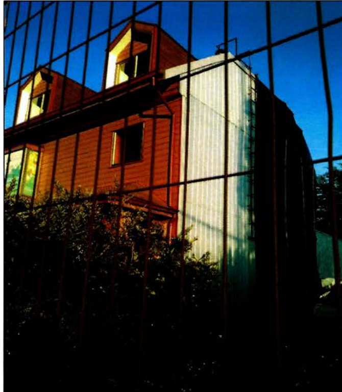
Vista lateral derecha desde el exterior