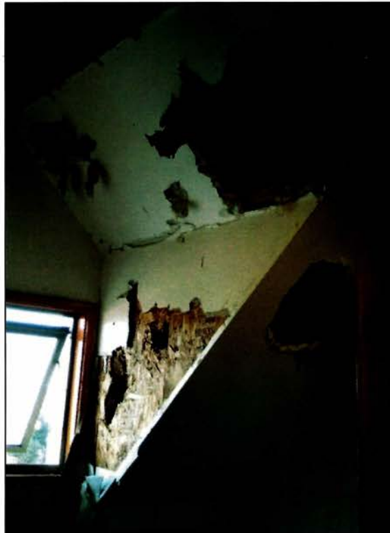
Recintos tercer piso