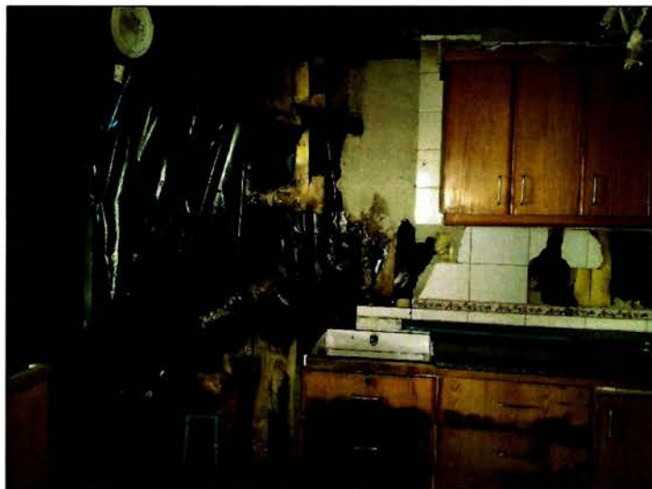
Sector cocina – punto de origen del siniestro