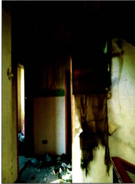
Sector llegada tercer piso